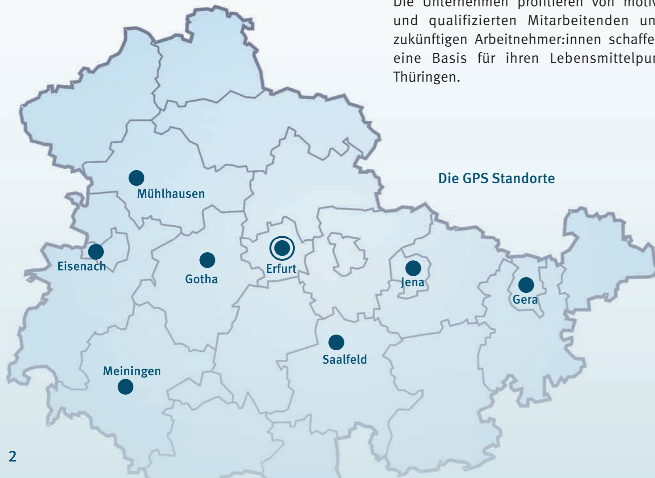
Die GPS Standorte

Die Unternehmen profitieren von motivierten und qualifizierten Mitarbeitenden und die zukünftigen Arbeitnehmer:innen schaffen sich eine Basis für ihren Lebensmittelpunkt in Thüringen.